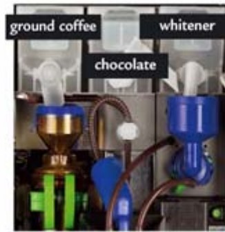
Fresh Brew Plus Coffee

Café Sólo Café Largo Café Cortado Café con Leche Leche Manchada CANCELAR DESCAF. Leche Caliente Agua Caliente